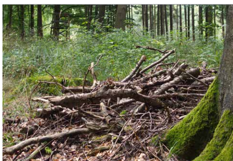
Zusammengetragener Totholzhaufen zur Ansiedlung von Tieren

Das Spiel ist beendet, wenn nur noch ein Kind seinen Stock hat. Bleiben Sie nach dem Stockspiel in der Runde.