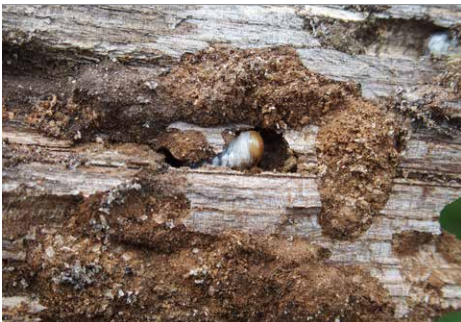
Mit einem Stöckchen darf im Totholz nach Lebewesen gesucht werden