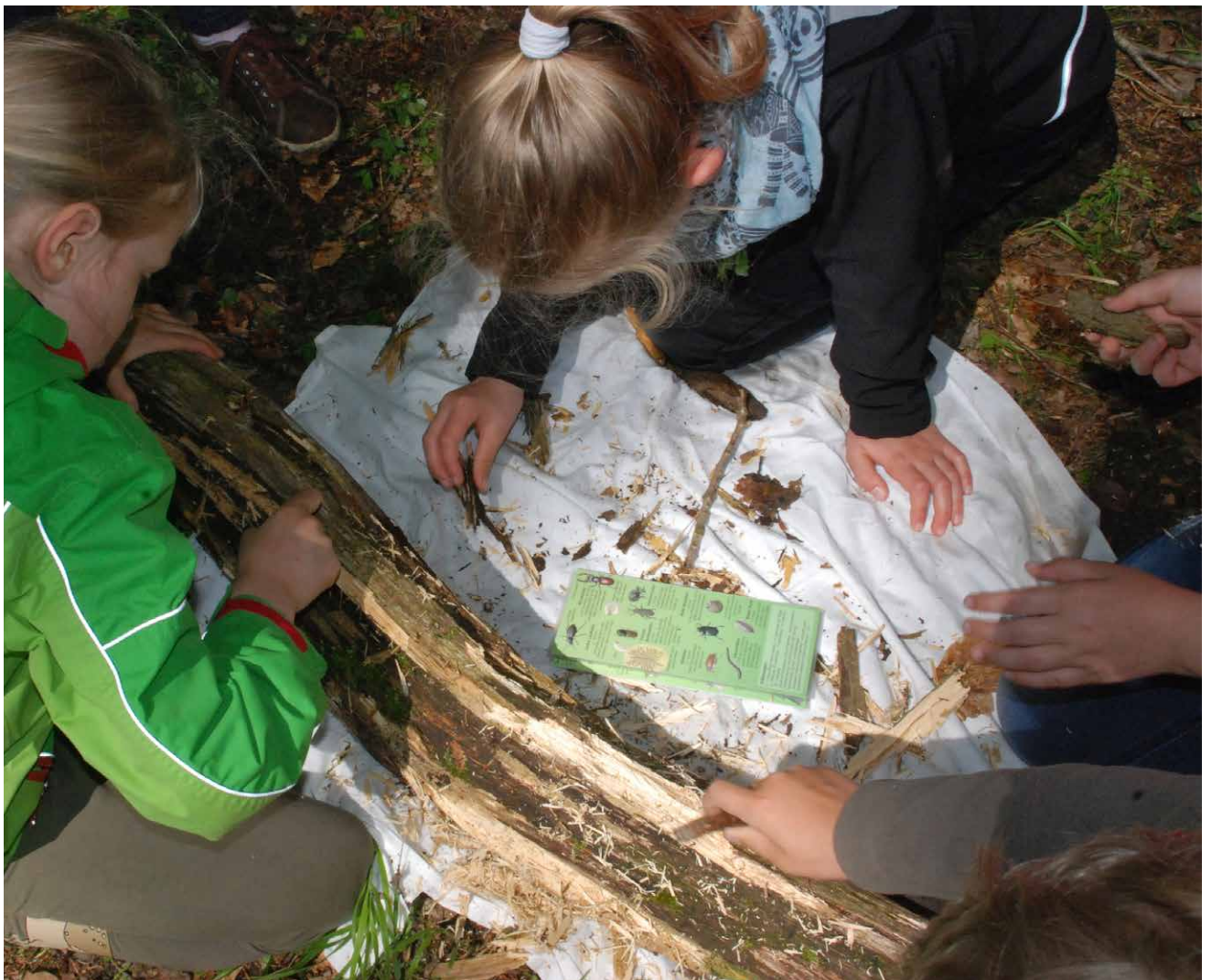
Die Kinder entdecken vorsichtig die Welt der Totholzbewohner

dass etwa ein Fünftel der Pflanzen und Tiere des Waldes, d.h. über 6.000 Arten, auf Totholz als Lebensraum und Nahrungsquelle angewiesen sind? Darunter sind 1.200 Käferarten, 2.500 Pilzarten, aber auch viele Vögel.