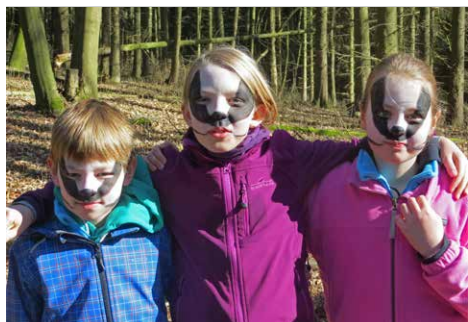
Kinder als Dachse geschminkt

In Kleingruppen entscheiden sich die Kinder für eines der Tiere von den Bildkarten aus der Aktivität „Wer wohnt denn da?“. In der Gruppe überlegen sie noch einmal, wo das abgebildete Tier im Totholz lebt und gestalten gemeinsam Masken, mit denen sie die charakteristische Erscheinung dieser Tierart darstellen können. Schnell werden Stöcke zu Käfer- oder Spinnenbeinen, Blätter zu einem Federkleid oder zarte Zweige zu Fühlern.