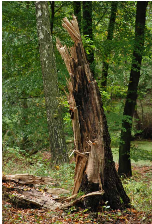
Leicht bis stark zersetztes Totholz

Mitunter sind auch Kompromisslösungen möglich, die sowohl die Bedürfnisse des Naturschutzes als auch die wirtschaftlichen Ziele der Forstwirtschaft berücksichtigen, z.B. Erhalt von Reisig- und Totholzhaufen. Ein zusätzlicher Vorteil, wenn das Holz im Wald verbleibt, ist, dass die Nährstoffe der Verjüngung des Waldes weiterhin zur Verfügung stehen.