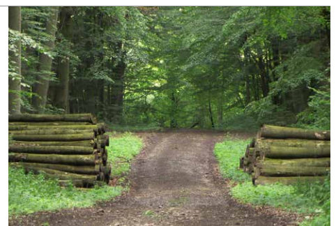
Holzpolter an einer Waldschneise zum Abtransport für die weitere Holzverarbeitung

Die Kinder stellen nun ihre Erkenntnisse zusammen und der anwesende Förster übernimmt die Rolle des Vermittlers gegenüber dem „Waldbesitzer“. Ein positiver Ausklang kann sein, dass sich der Waldbesitzer einsichtig zeigt. Gestalten sie das Ende an dieser Stelle individuell.