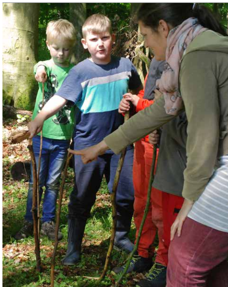
Der Stock reicht ungefähr bis zum Bauch

Nach so vielen Eindrücken und neuem Wissen tut Bewegung gut. Das „Stockspiel“ macht Kindern Spaß und fördert gleichzeitig Konzentration und Teamarbeit. Die notwendigen Materialien (Stöcke) finden Sie in jedem Wald.