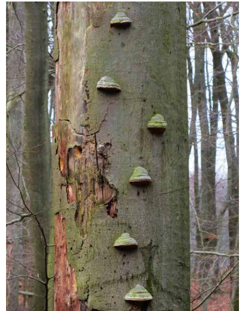
Totholz im Zersetzungsprozess durch Pilze ist gleichzeitig Lebensraum für Höhlenbewohner

Wisst ihr, warum der Eichelhäher auch „Hüter oder Polizei des Waldes“ genannt wird?