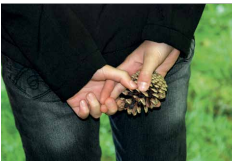
Den Wald durch Tasten kennenlernen

Legen Sie ein Quadrat aus Stöcken. Die Kinder betrachten, was dort wächst, liegt und schließen die Augen. Es wird nun etwas im Quadrat verändert. Die Kinder finden die Veränderung heraus.