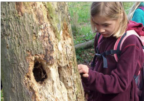
Wie sind diese Baumlöcher entstanden?

Wer ist nicht gerne mal ein Detektiv, der Spuren verfolgt und knifflige Rätsel löst? Kinder mögen Detektivspiele. Mit einer kleinen Geschichte als Rahmen der Veranstaltung können Sie sie schnell motivieren, sich mit dem Thema auseinanderzusetzen.