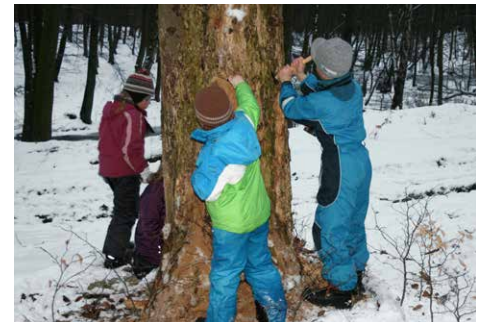
In der Rolle eines Spechtes: Löcher picken am Totholzbaum