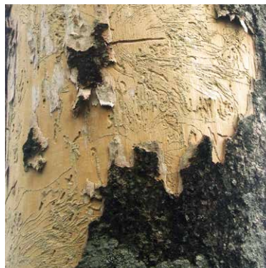
Fraßbild eines Eschenbastkäfers

Wer war es? Es können viele Tiere gewesen sein auf der Suche nach Insekten.