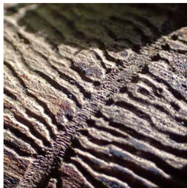
Fraßbild vom Buchdrucker