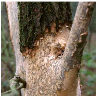
Mäusefraß am Holunder

Von welchen Tieren könnten die Spuren an den Bäumen stammen? Welche Tiere nutzen Baumhöhlen? Sprechen Sie mit den Kindern darüber. Sicherlich wissen sie schon einiges. Die gefundenen Spuren werden in der Gruppe gezeigt und gemeinsam überlegt, woher sie stammen könnten. Mit Hilfe eines Tierrätsels kann bei unbekanntem „Täter“ auch ein „Täterprofil“ erstellt werden. Siehe Aktivität „Finger auf die Nase“ Seite 8.