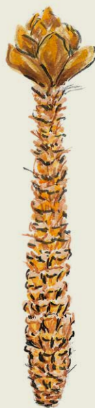
von der Maus