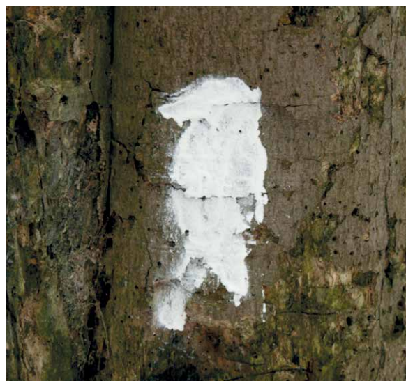
Spechtbaum-Markierung an einem toten Baum

Stehendes Totholz wird mit mindestens 2-5 Bäumen je Hektar von den Forstleuten im Wald belassen. Spechtbäume werden in einigen Regionen Deutschlands mit einem „H“ (für Habitat) oder einer Spechtsilhouette gekennzeichnet und nicht abgeholzt. Schon mal im Wald gesehen?