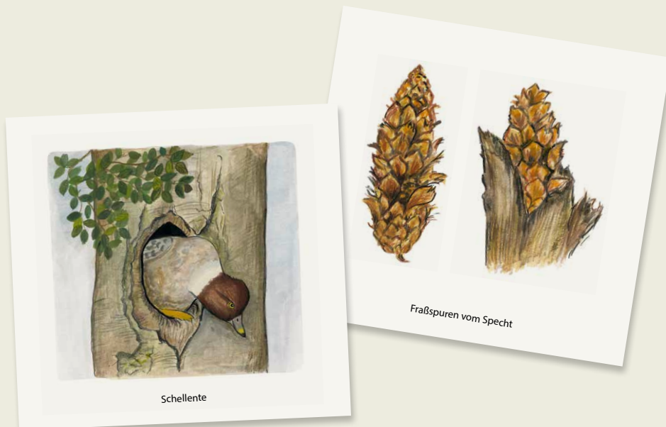
Bildkarten „Baumhöhlenbewohner“ und „Spechtspuren“