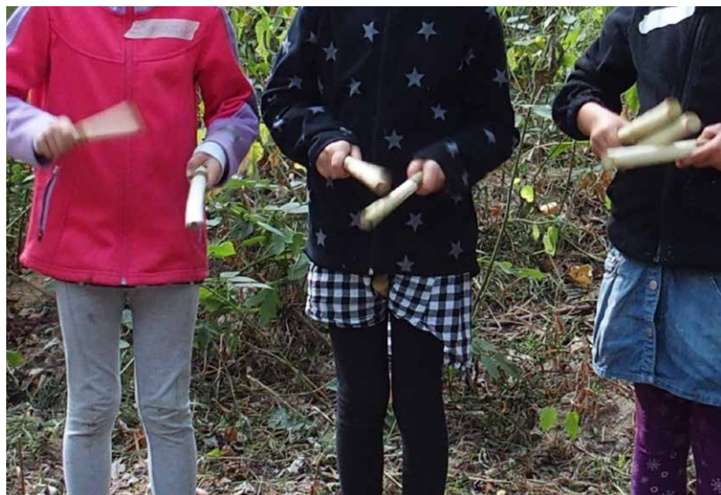
Spechtsinfonie begleitet durch selbstgeschnitzte Klanghölzer

Lassen Sie den Tag mit der „Spechtsinfonie“ ausklingen und gehen Sie mit einem „Ohrwurm“ fröhlich nach Hause!