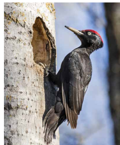
Die häufigsten Specharten sind (v.l.): Buntspecht, Grünspecht und Schwarzspecht