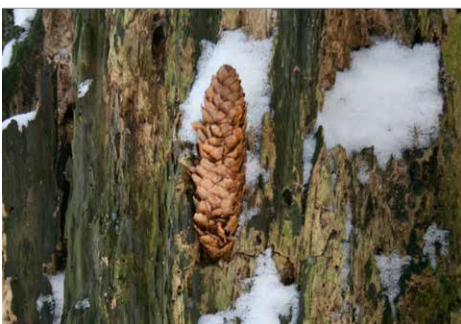
Spechtschmiede an einem morschen Baum