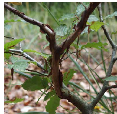
Fegeschaden vom Rehwild