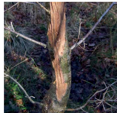
Rotwildschäle an junger Eiche