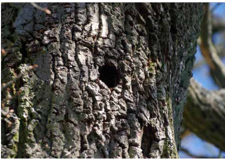
Viele Tierarten benötigen Baumhöhlen als Lebensraum

Wichtig ist es, dabei zu wiederholen, dass die Löcher des Spechtes keine Schäden im eigentlichen Sinne sind, sondern zur Natur- und Artenvielfalt beitragen sowie einen besonderen Lebensraum markieren.